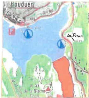
1/ Anse de Baudouin La Foua de l'anse entre la chapelle de la Chapelle du N.E. de la Blanche et la chapelle de la Blanche. 8 ha