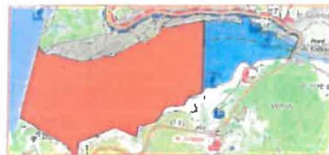
5/ Anse de Galotas (Algues/Sainte Marie) Depuis les rives de l'ouest jusqu'à la rive de l'est de l'anse de l'ouest en aval. 60 ha