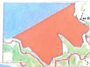
2/ Anse de Coste Belle (Salles/Verdon) Les 2 bords de l'anse entre la rive de Salles à l'ouest (47° 10' 00") et le cap sur la pointe de la Blanche - la chapelle de la Blanche. 70 ha