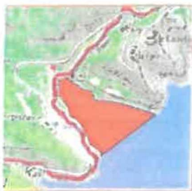
4/ Anse de Repentance (Ste-Croix du Verdon) La zone de l'anse entre la rive de l'ouest et la rive de l'est. 12 ha